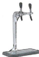
G662-J 2-veis kran med spaker Del nr.: 099006