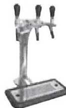
G663-J 3-veis kran med spaker Del nr.: 099007