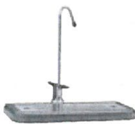
G612-J 2-veis kran med spaker Del nr.: 099004