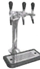
G663 3-veis kran med spaker Del nr.: 090099