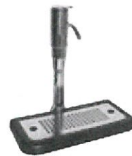
G68WG 3-veis kolonnekran Del nr.: 099041