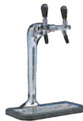
G662 2-veis kran med spaker Del nr.: 090018