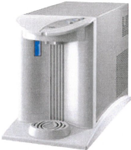
Jet A Grey

Jet leveres med grålakkert kabinett og dekorplater i plast. Jet har en isbank som kjøler ned vannet. Dette gir stor kapasitet og jevn temperatur i det nedkjølte vannet. A leveres med kjølt- og ukjølt vann. WG har CO2 i tillegg (engangsbeholder og reduksjonsventil er inkludert). In er "under benk" løsning med separat kran. Velg kran til In maskinen i tabellen. Jet kan leveres med kabinett som vist på forsiden av drikkevannskjølere. Alle drikkevannskjølerne leveres med trykkreduksjonsventil for vannet inkludert i prisen. Alle maskinene er beregnet for et vanntrykk på 3bar.