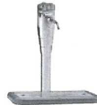
G68WG-J 3-veis kolonnekran Del nr.: 099040

Se www.porkka.no for brosjyrer og teknisk informasjon