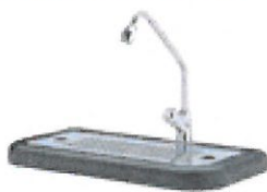
G65 1-veis kran med trykknapp Del nr.: 090017