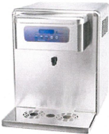
Top Dryppenne er ikke inkludert

Alle maskinene er beregnet for et vanntrykk på 3bar.